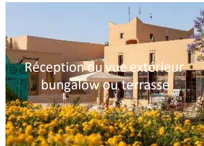
Réception ou vue extérieur bungalow ou terrasse