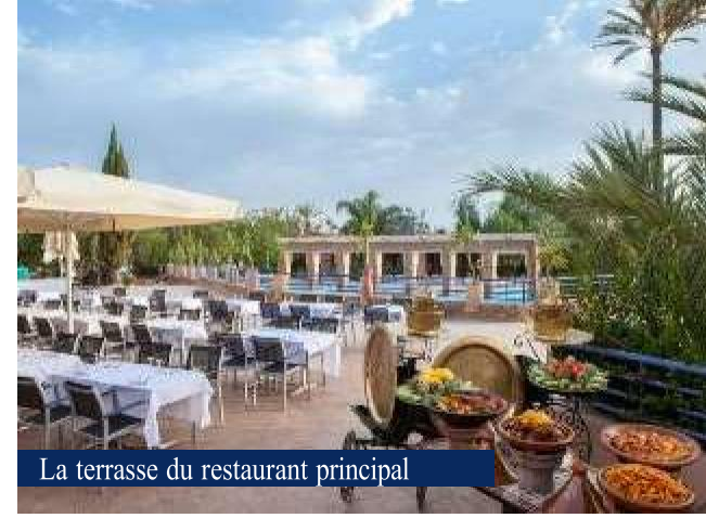
La terrasse du restaurant principal