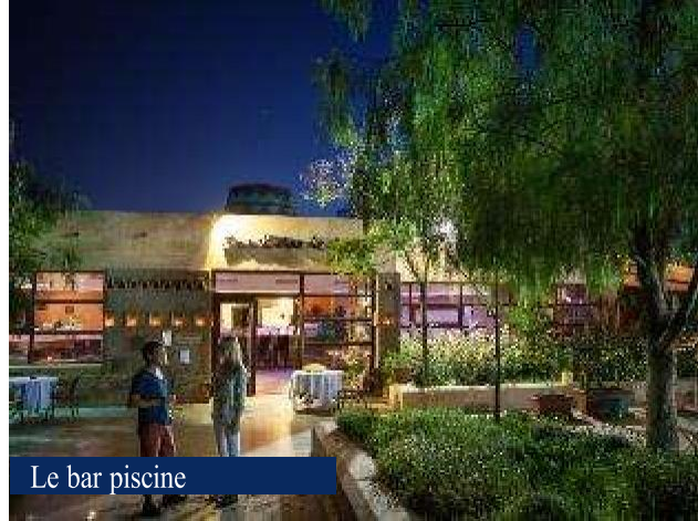
Le bar piscine