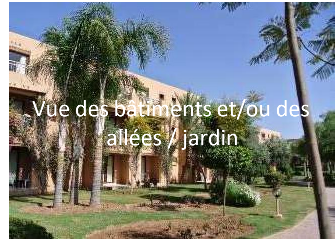
Vue des bâtiments et/ou des allées / jardin

Le tout au cœur d'un grand parc verdoyant de près de 12 hectares, enserrant un jardin traditionnel avec plan d'eau.