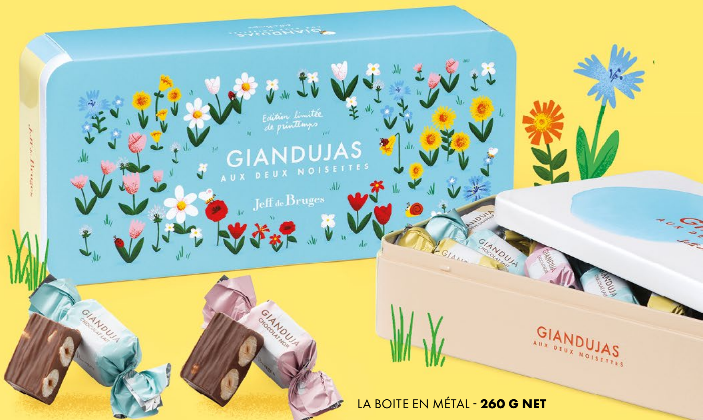
Chocolat au lait

Imaginez notre fameux gianduja dans lequel sont plongées non pas une mais deux noisettes entières. Voici l'alliance exquise du croquant et du fondant !